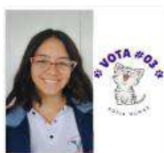
Candidatos 491 respuestas