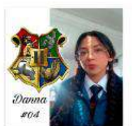
Curso 491 respuestas