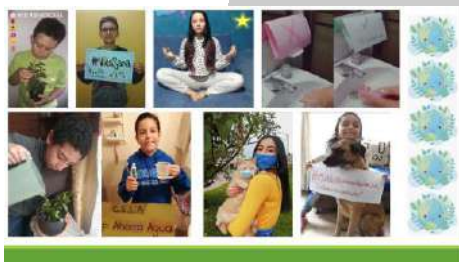
Imagen 1. Semana ambiental

Durante la fase de charlas educativas observamos la motivación del estudiante a la participación e investigación tecnológica, con el desarrollo de las distintas actividades realizadas demostramos el concepto de la educación ambiental y el cuidado en casa (Imagen 1). La feria de la ciencia y tecnología genero un espacio de intercambio de ideas, divulgación de conocimientos científicos (Imagen 2), con esto, promovemos estrategias didácticas novedosas despertando la vocación científica de los estudiantes.