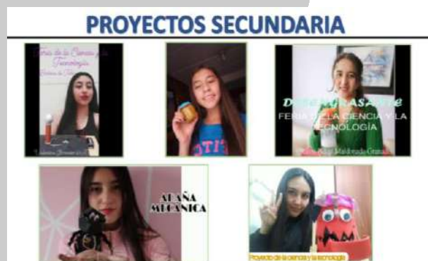
Imagen 2. Feria de la ciencia y tecnología

El modelo de aprendizaje enfocado en la ciencia, tecnología e innovación es altamente práctico en vista que, fomentamos el desarrollo de la creatividad e investigación científica de los estudiantes, podemos concluir que es una estrategia didáctica de enseñanza que puede ser considerada como un método de educación en el área de ciencias naturales.